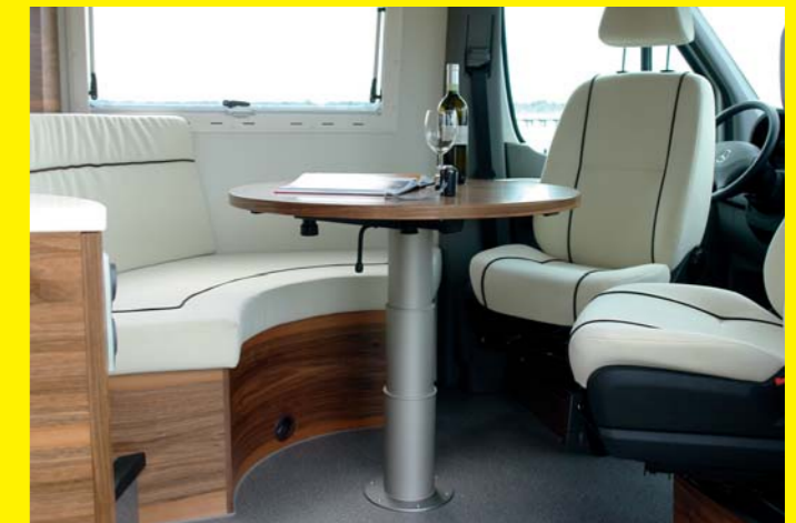
Die Sitzgruppe bietet vier Personen ausreichend Platz.