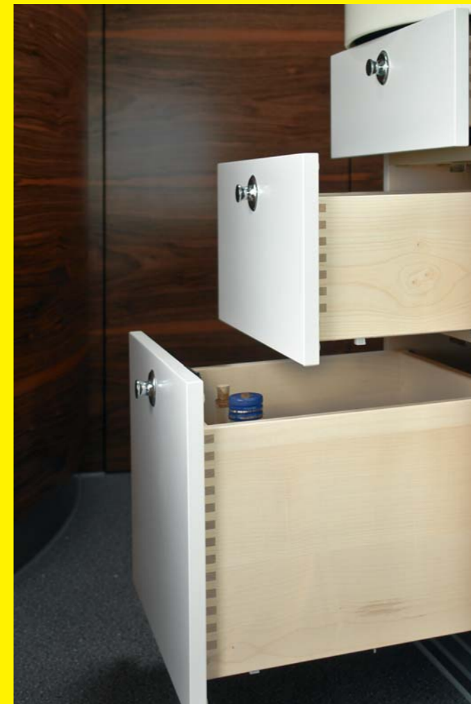
Gezinkte Schubkästen mit Softeinzug, belastbar mit 30 kg