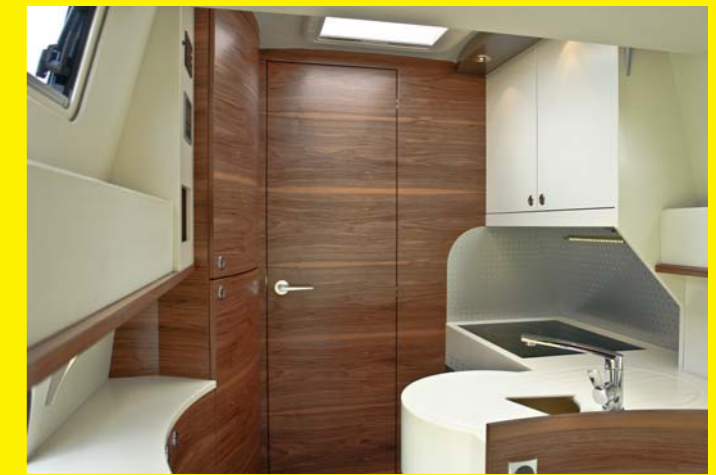
funktionelle, großzügige Küche