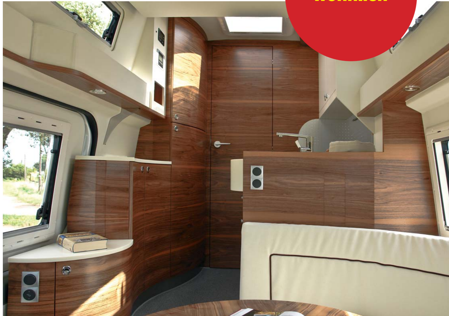
Die Fotos zeigen die Sonderausstattung »Möbeldekor exclusiv« in franz. Nussbaum.