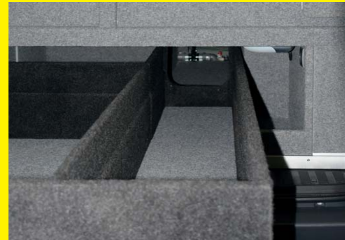
Großer Stauraum im doppelten Boden (optional mit Stauraumschublade), Zugang über die Hecktüren.